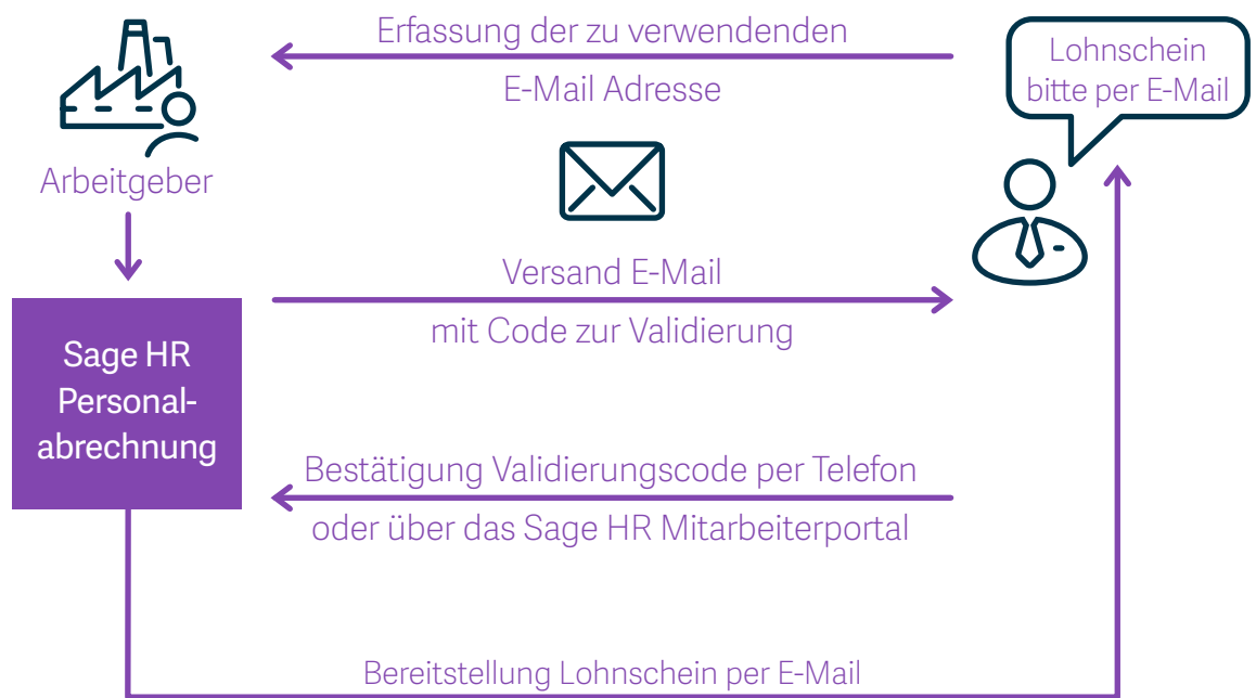
Anwendungsbeispiel: Interaktion mit den Mitarbeitern zur Nutzung des Dokumentenversandservices